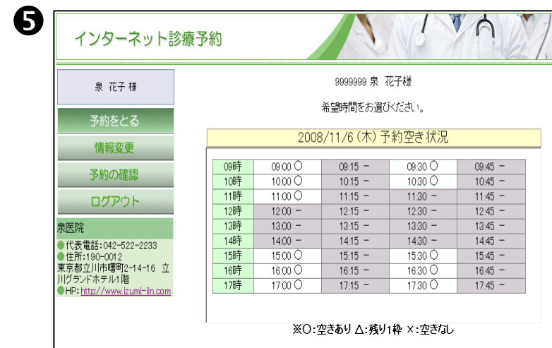
⑤ご希望の予約時間を選択します。

(④の予約希望日を選択後、画面を下にスクロールすると時間の画面が表示されます。)