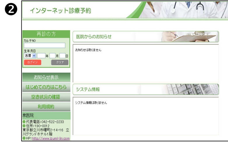
②診察券表面上部に記載されているカルテNOと生年月日を入力し、ログインします。