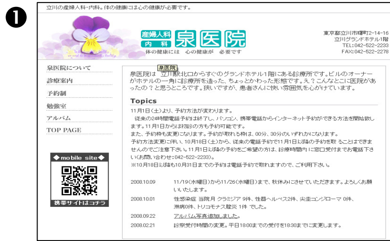
①画面の【インターネット予約はこちらから】をクリックします。

利用環境 OS: Microsoft WindowsXP (ServicePack2 適用済)、Windows Vista ブラウザ: Internet Explorer6.0 (ServicePack2) / 7.0