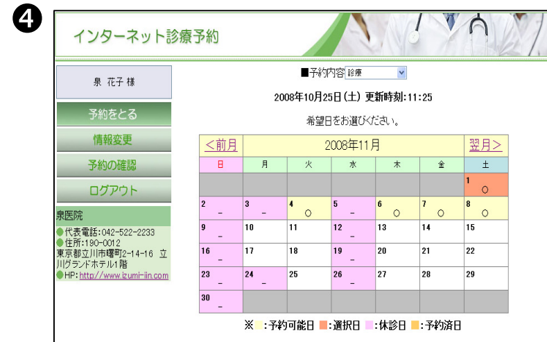
④ご希望の予約日を選択します。